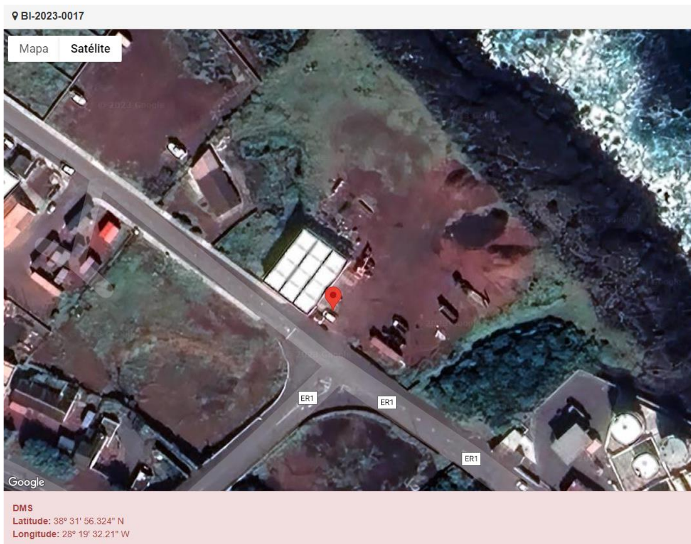
Figura 1.1: Localização do estabelecimento inspecionado.

Licenciamento da atividade: Alvará n.º 5/DRA/2020, válido até 26 de agosto de 2025.