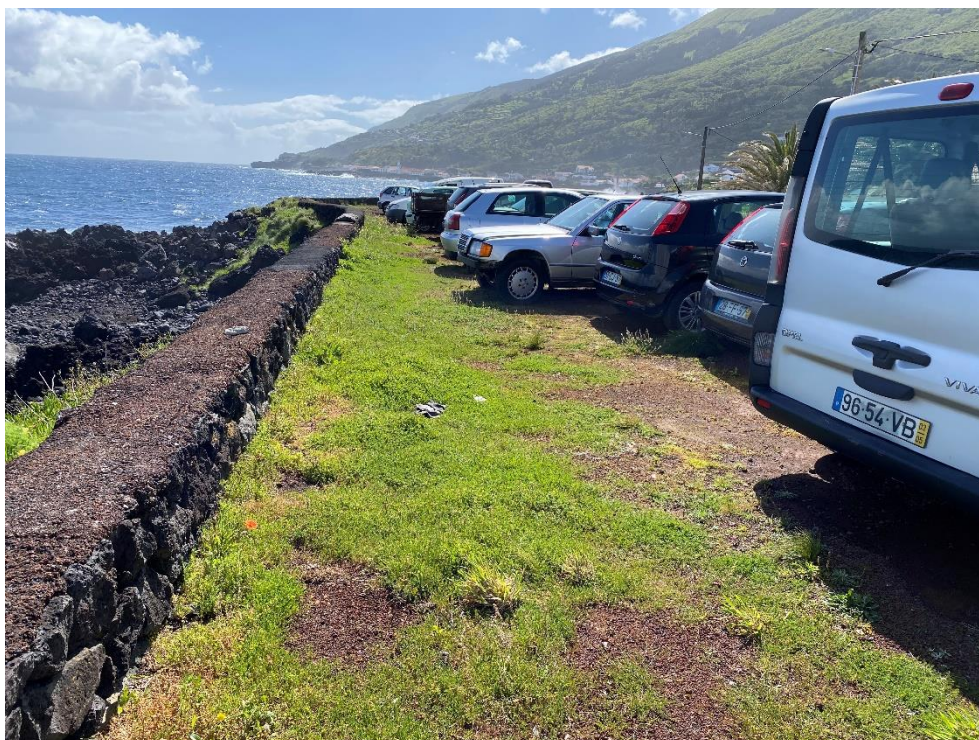
Foto 1 – Carros estacionados na parcela de terreno em frente à oficina, do outro lado da estrada.

Não se verificou a presença de resíduos nem quaisquer vestígios de derrames de óleos.