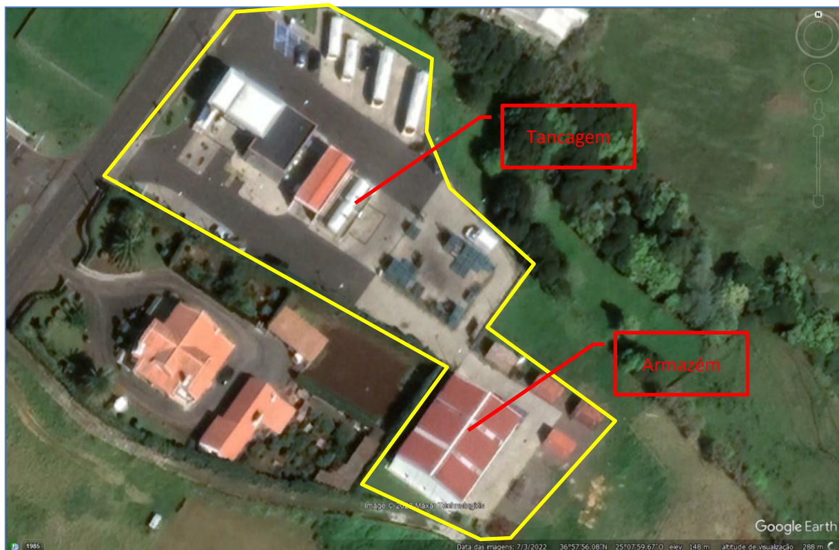
Figura 2.1: Instalações do operador.