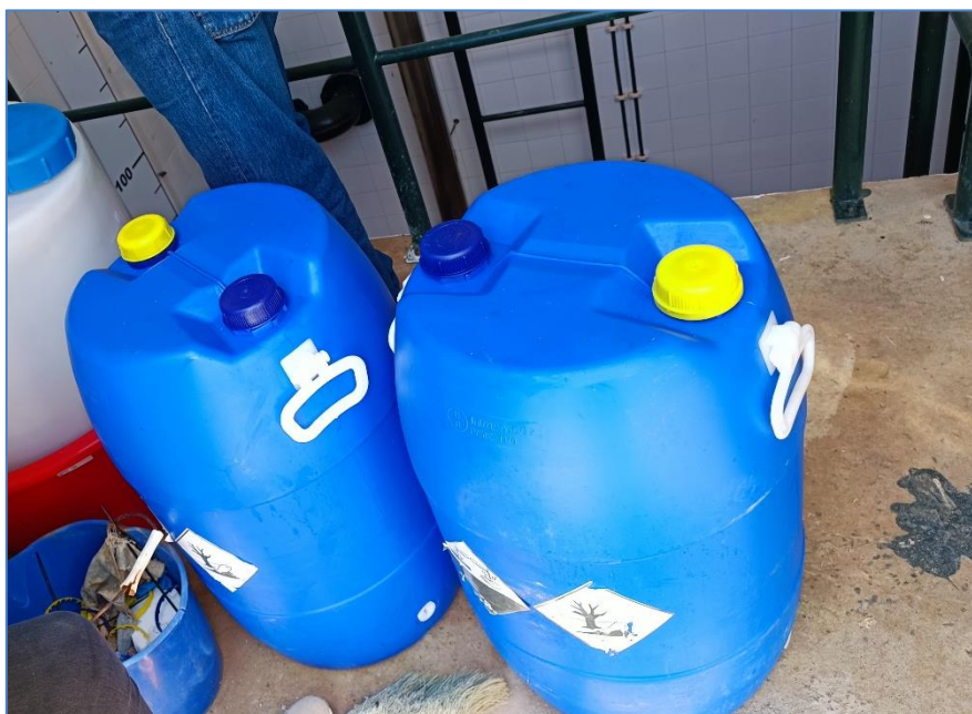
Figura 2.3: Embalagens usadas de hipoclorito contendo água.