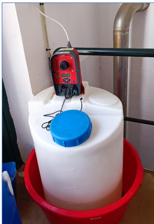
Figura 2.2: Desinfecção e cloragem.