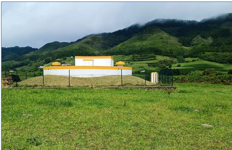
Figura 2.1: Reservatório do Monteiro.