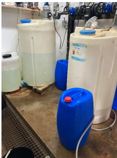
Figura 2 – Reservatórios de desinfecção

Nas instalações existiam, também, dois reservatórios de desinfecção (contendo hipoclorito de sódio diluído), sendo um deles para a lavagem dos equipamentos e o outro para a desinfecção da água para consumo humano, através de uma bomba doseadora.