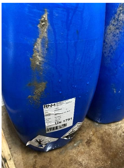
Figura 3 – Recipientes contendo hipoclorito de sódio.

Os recipientes contendo hipoclorito de sódio (Bechlor WT 13%), com uma capacidade de 60 litros, não se encontravam sobre/numa bacia de retenção.