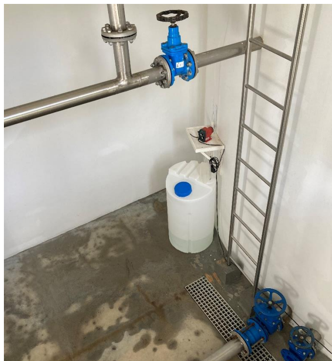
Figura 3 - Bomba doseadora e recipiente com solução de hipoclorito de sódio