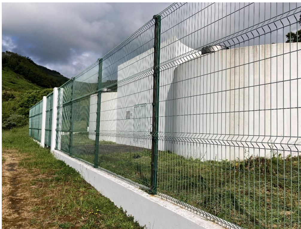
Figura 2 – Perspetiva exterior do reservatório dos Vales