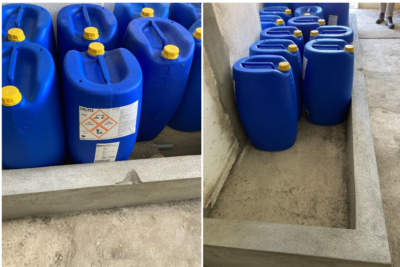
Figura 4 e 5 – Armazenamento dos recipientes contendo hipoclorito de sódio, num armazém da autarquia.

Os recipientes contendo hipoclorito de sódio (Bechlor WT 13%), com uma capacidade de 60 litros, encontravam-se armazenados num armazém da autarquia, numa bacia de retenção e com a informação sobre a perigosidade do hipoclorito de sódio afixada.