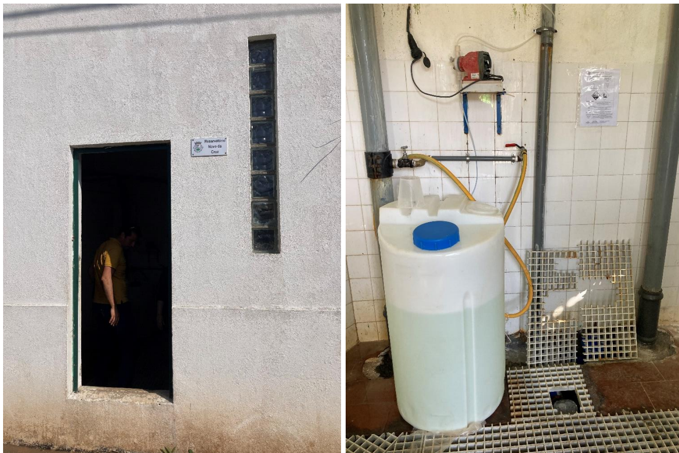
Figura 2 e 3 – Perspetiva exterior do reservatório Novo da Cruz; Bomba doseadora e recipiente com solução de hipoclorito de sódio.

À entrada do reservatório é injetada na tubagem, com bomba doseadora, uma solução de hipoclorito de sódio a 13%. Efetuam testes de cloração no consumidor duas vezes por semana.