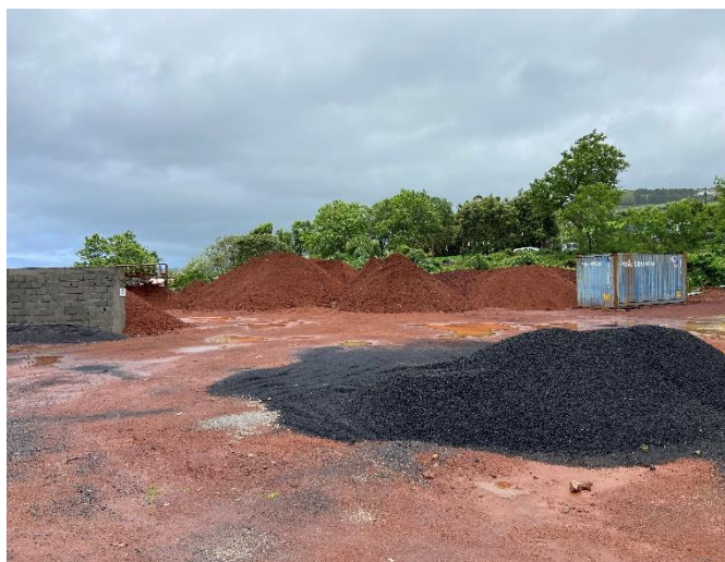
Foto 3 e foto 4 – Terreno regularizado com depósito de inertes e sem resíduos.