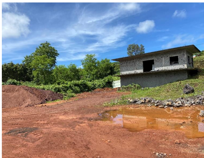
Foto 8 – Terreno sem resíduos após encaminhamento dos mesmos para OGR.