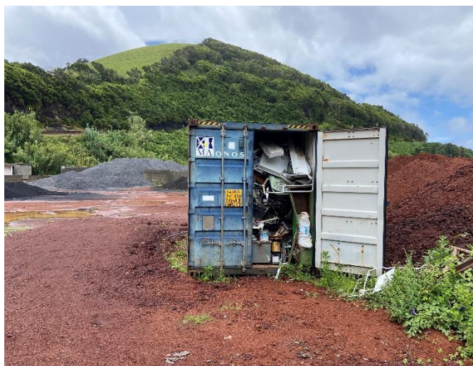
Foto 6 – Contentor marítimo com resíduos de metal para encaminhamento.