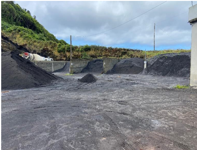
Foto 1 – Baías de armazenamento de resíduos, utilizadas para armazenamento de inertes.