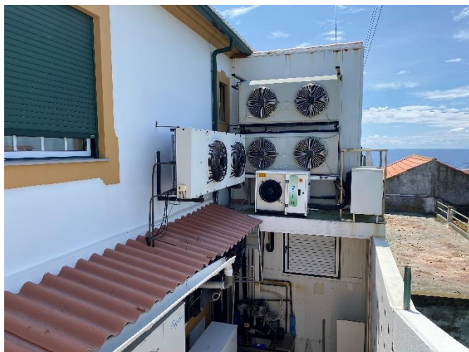
Foto 1 – Alguns equipamentos cuja dificuldade de acesso não permitiu averiguar as suas cargas.

NOTA: Foram identificados, em fotos (abaixo), outros equipamentos cuja dificuldade de acesso não permitiu averiguar as suas cargas. A entidade não mantém registo dos equipamentos contendo GFEE.