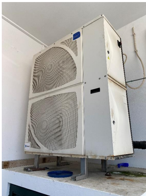
Foto 4 – Alguns equipamentos cuja dificuldade de acesso não permitiu averiguar as suas cargas.