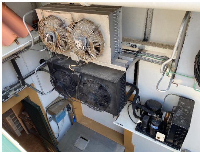
Foto 2 – Alguns equipamentos cuja dificuldade de acesso não permitiu averiguar as suas cargas.