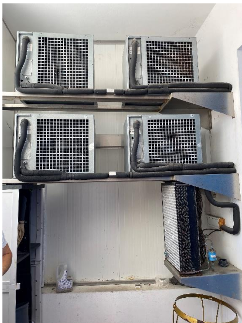
Foto 3 – Alguns equipamentos cuja dificuldade de acesso não permitiu averiguar as suas cargas.