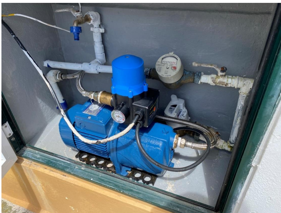
Foto 2 – Bomba de água colocada em cima de uma borracha, para isolamento/redução da vibração.