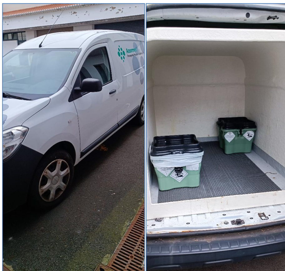
Figura 2.2: Viatura de recolha de resíduos.