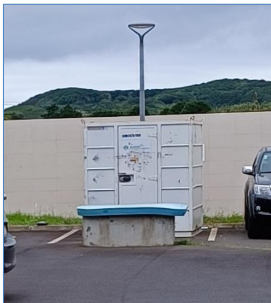
Figura 2.1: Contentor refrigerado de armazenamento de resíduos.