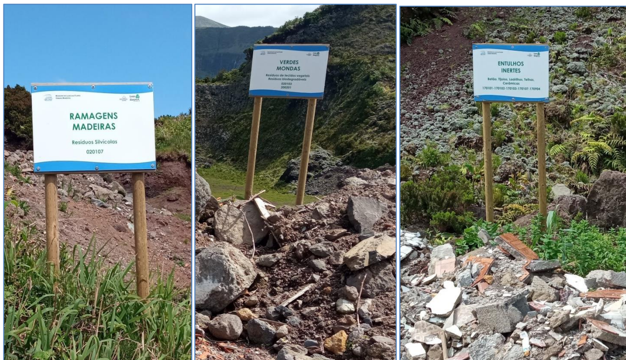
Figura 2.1: Placas de identificação de resíduos.

No local verificou-se que tinham sido colocadas placas com a identificação dos resíduos por nome comum e código LER, abrangendo todas as tipologias constantes do alvará (figura 2.1), dando cumprimento à notificação.