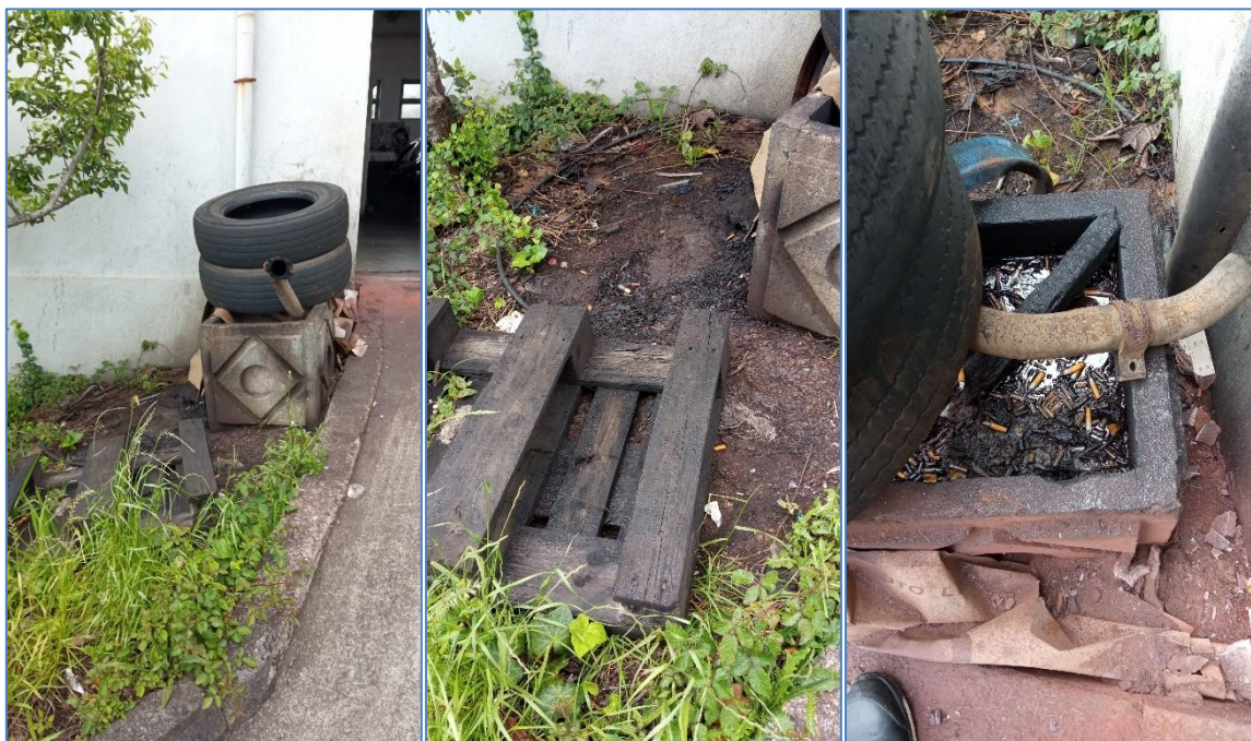
Figura 5.2: Derrame de resíduos oleosos no solo.