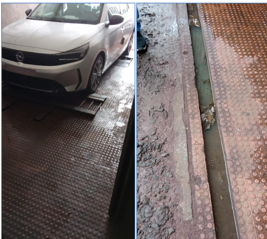
Figura 4.1: Águas residuais produzidas na zona de lavagem de viaturas.