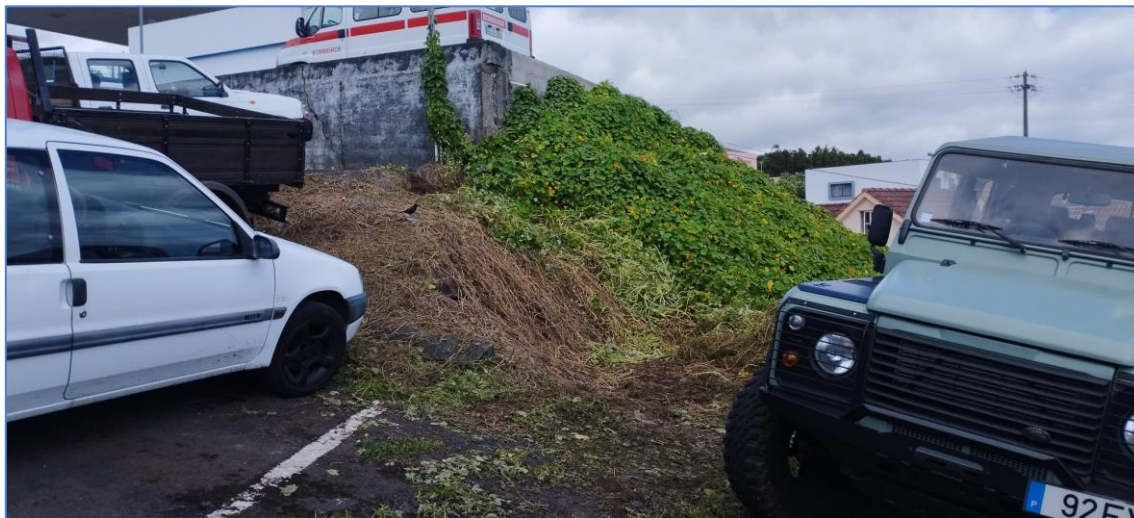
Figura 11.1: Foto do local após remoção dos pneus.