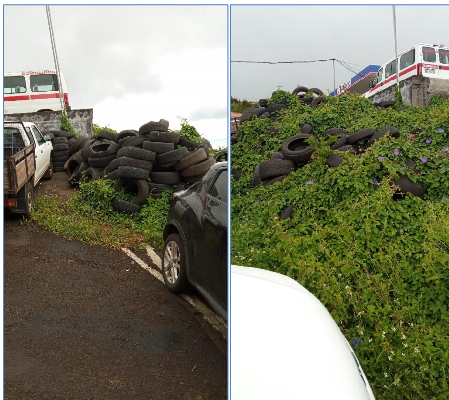
Figura 5.3: armazenamento de pneus usados.