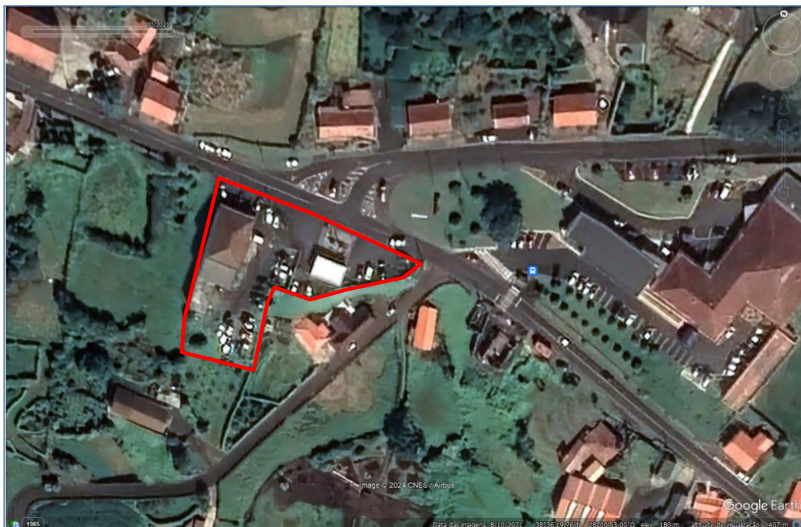
Figura 2.1: Instalações da Severino & Silva, Lda (adaptado de Google Earth).