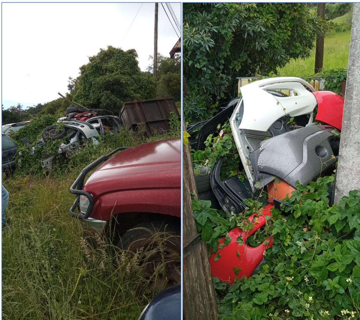
Figura 5.4: armazenamento de resíduos metálicos e de plástico.